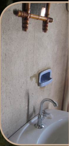
Salle de bains avec douche et toilettes