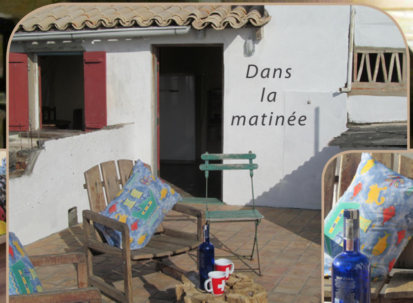
Dans la matinée